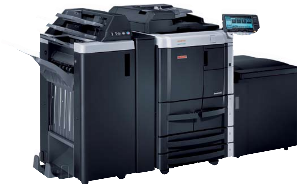
іneo 601 обладнаний буклетним фінішером FS-610, приладом для вставки сторінок та обкладинок PI-504 та касетою великої ємності LU-405

При необхідності, можливе підключення опції факсу або додаткових професійних фінішерів, які дозволяють не лише зшивати, виконувати перфорацію та автоматично складати надруковані оригінали "під конверт", а також вставляти, у раніше виготовлену продукцію, інші матеріали або обкладинки. Саме тому, завдяки стандартній комплектації та додатковим можливостям, багатофункціональні пристрої Develop іneo 601/751 є дійсно продуктивними системами, які здатні виготовляти справді професійну продукцію.