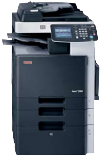
ineo+200 із автоподавачем документів (DF-612), розподілювачем робіт (JS-505), лотком прямої подачі (MB-502), універсальною касетою для паперу (PC-105) та великою касетою для паперу (PC-405)

Використання кольору при друкуванні і копіюванні все більш стає повсякденною нормою сучасного життя. Розмірковувати починають навіть ті компанії, які досі вважали, що кольоровий друк – це дорого! Саме для таких компаній Develop пропонує повнокольірну багатофункціональну систему початкового рівня ineo+ 200 - ідеальне рішення для тих, хто остаточно вирішив прийняти колір але коливається, очікуючи знайти просте та економічне рішення. До того ж, завдяки сучасному дизайну Infoline офісних систем TM Develop нової генерації, ineo+ 200 стане привабливим доповненням офісного приміщення.